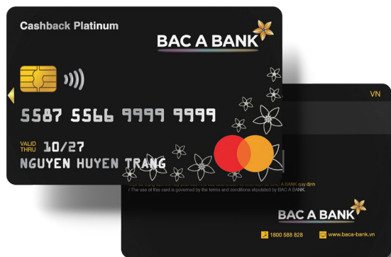
Thẻ tín dụng quốc tế BAC A BANK MasterCard Cashback Platinum - ENJOY LIVING