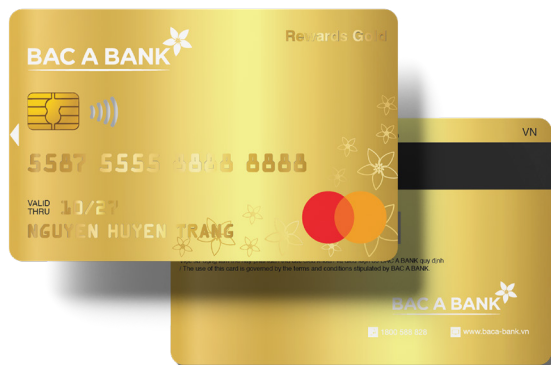
Thẻ tín dụng quốc tế BAC A BANK MasterCard Rewards Gold - HAPPY LIFE